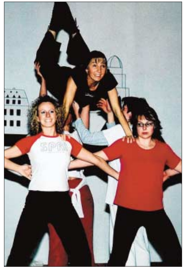
Akrobatische Hebefiguren, ein fester Bestandteil des Showtanzes, haben längst ein „Hoch das Bein“ abgelöst.