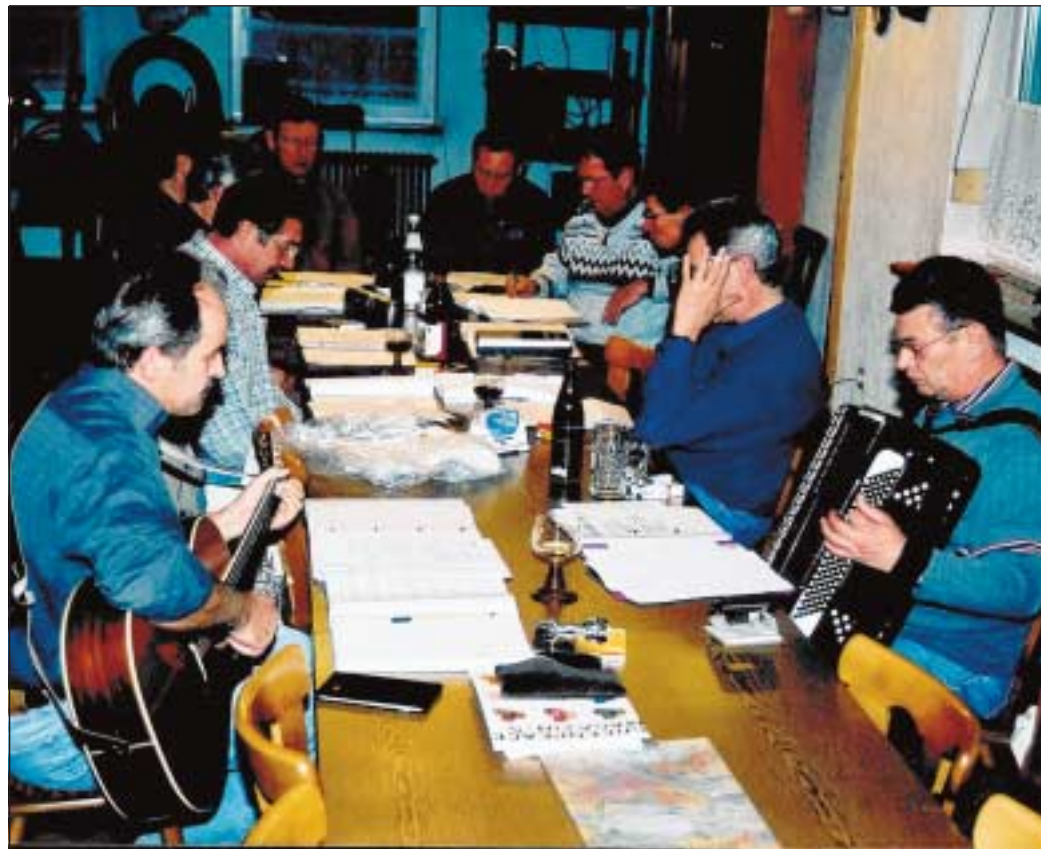
Die Kellersänger bei der Arbeit: Hier werden keine Weihnachtslieder geübt, sondern in hochkonzentrierter Runde Fastnachtstexte geprobt und einstudiert.